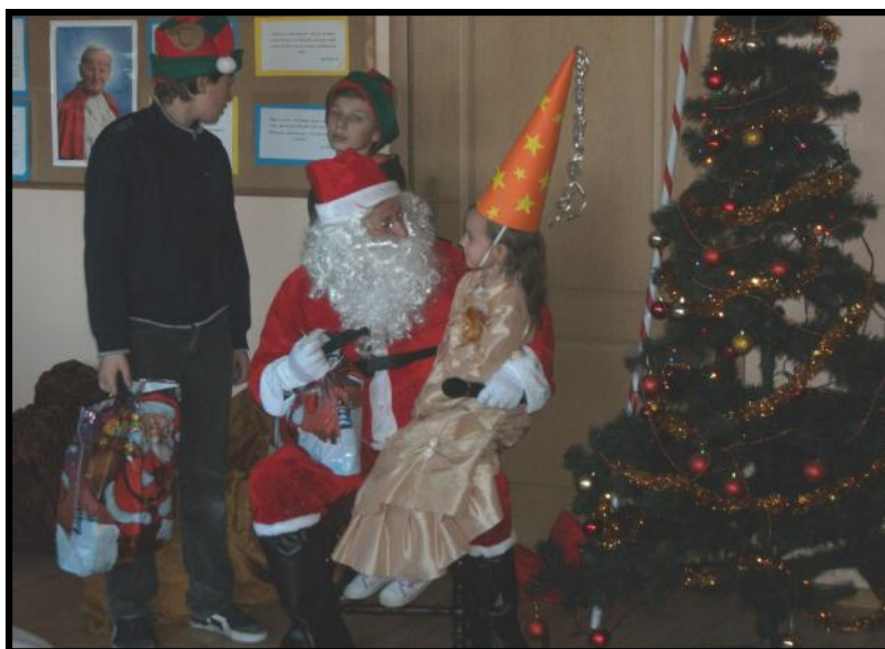
Karolinka odbiera prezent od Mikołaja