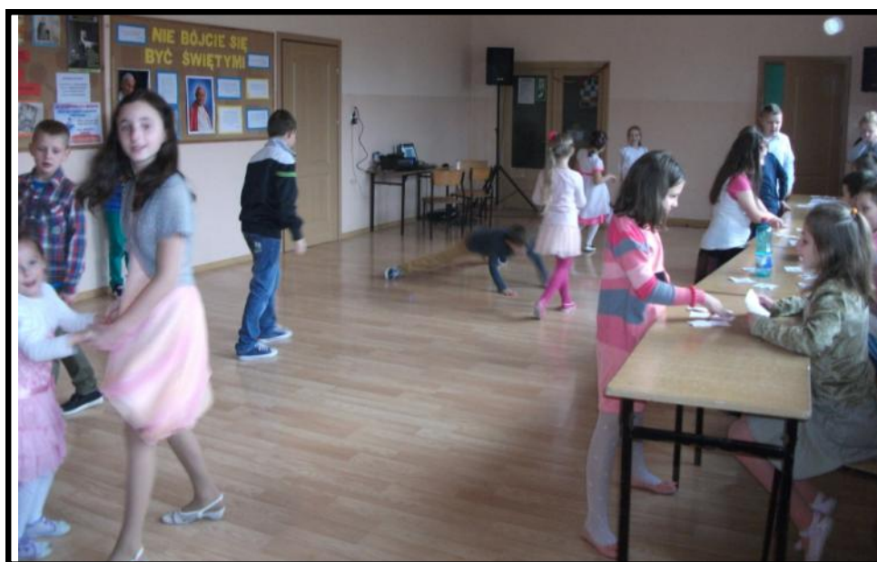
Tańce i zabawy uczniów