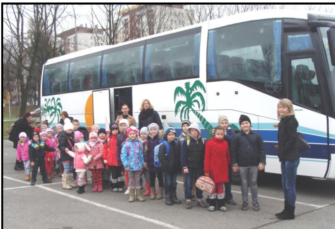
Cała grupa dzieci przed autobusem

filmu edukacyjnego o pszczołach i innych owadach. Następnie zadawała pytania związane z informacjami, które były w filmie. Wreszcie zaczął się film „Pszczółka Maja”. Cała grupa z zaciekawieniem oglądała seans. Droga powrotna minęła szybko. Wszyscy szczęśliwi rozeszli się do domów.