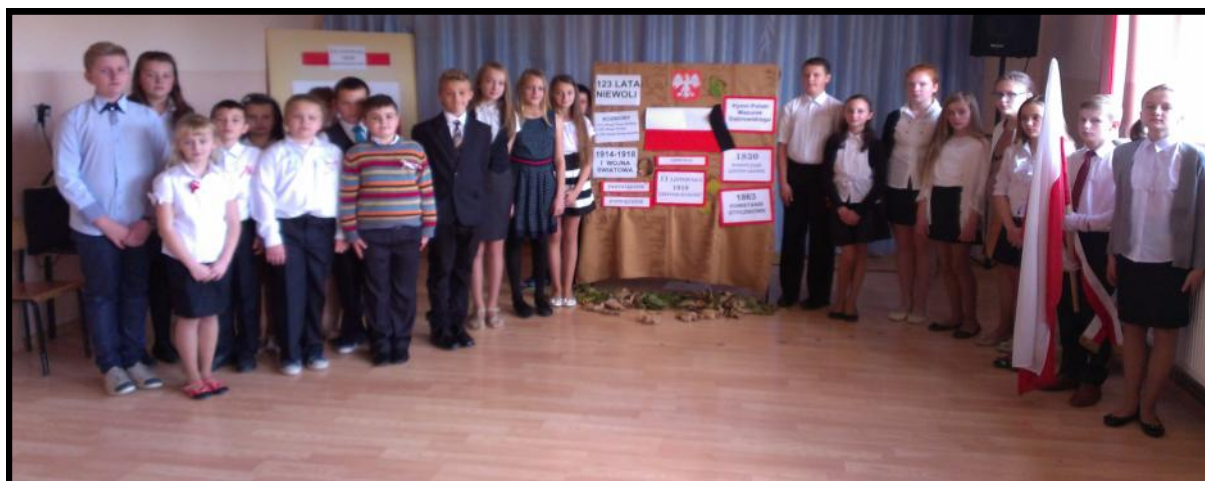
Uczniowie klas IV-VI podczas akademii

Jesteśmy dumni, że to dzięki naszym, polskim żołnierzom, ich odwadze i poświęceniu znów możemy żyć w wolnym kraju, w Polsce.