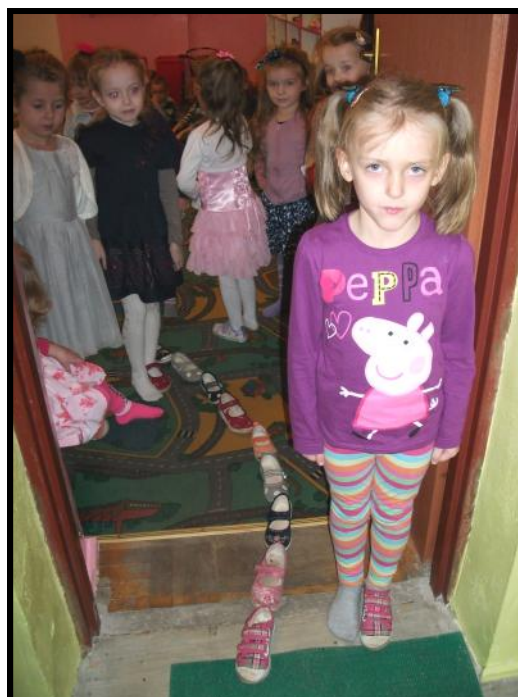
Wróżba, który but pierwszy wyjdzie za próg

Należy pamiętać też, że takich wróżb nie można traktować poważnie, chociaż nie jest wykluczone, że się nie spełnią.