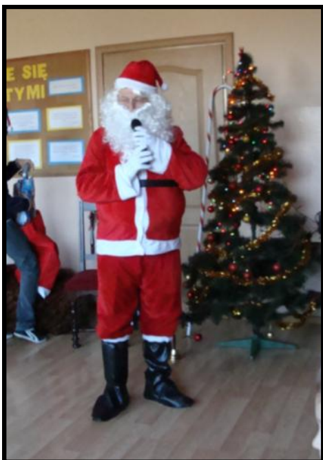
Mikołaj przemawia do dzieci

6 grudnia, jak dobrze wiecie Święty Mikołaj chodzi po świecie. Zawitał także do naszej szkoły. Wszystkie przedszkolaki bardzo długo czekały na to święto. Razem z paniami wychowawczyniami przygotowały piękną akademię dla ważnego gościa. Mikołaj wkrótce przybył z workiem pełnym prezentów. Przedszkolaki mimo stresu świetnie powiedziały wierszyki i zaśpiewały piosenki. W nagrodę otrzymały od Mikołaja piękne prezenty. Każdy siadał Mikołajowi na kolanie, a gdy on upewnił się, że był grzeczny, dostawał długo oczekiwany prezent. Niestety po uroczystości musieliśmy pożegnać naszego niezwykłego gościa. Czekamy na niego w przyszłym roku!