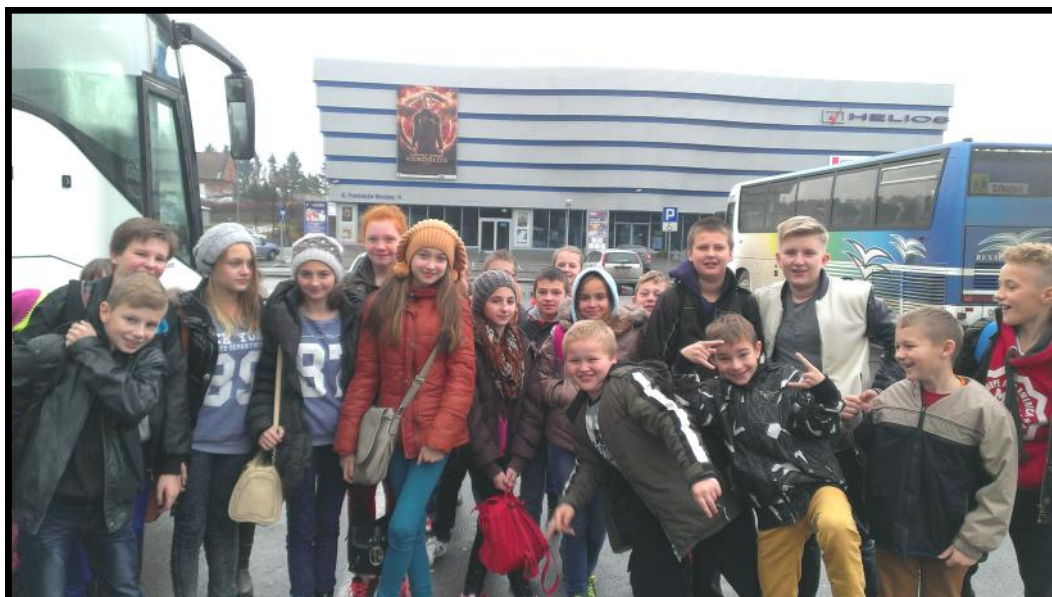
Uczniowie przy autobusie

21 listopada bieżącego roku uczniowie klas III, IV, V, VI wyjechali na wycieczkę do Rzeszowa do kina HELIOS na film pt. „ Bella i Sebastian ”. Opowiadał on o chłopcu, który spotkał w górach psa, którego dorośli uważali za bestię. Pies zaś chciał udowodnić, że to nie on pożera owce. Film wszystkim bardzo się podobał. Czekamy na więcej takich wycieczek!