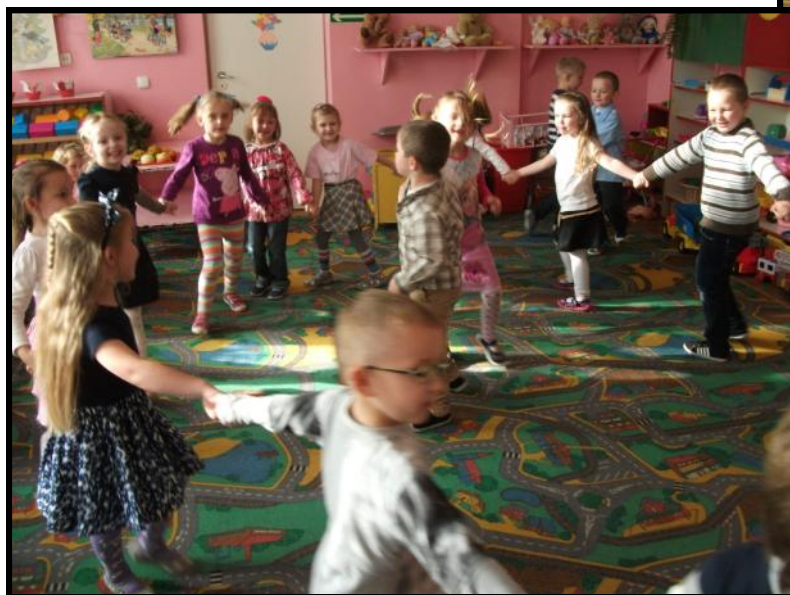
Przedzkolaki tańczą na andrzejkach