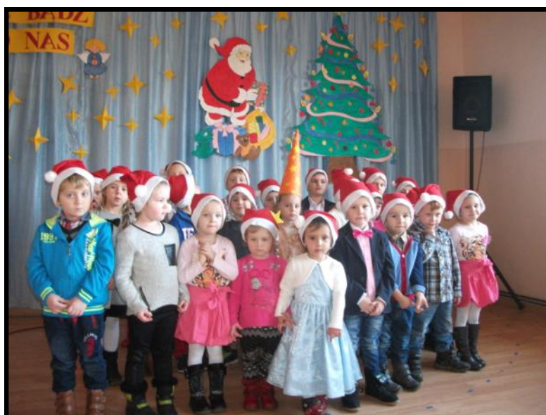
Dzieci czekają na przybycie Mikołaja