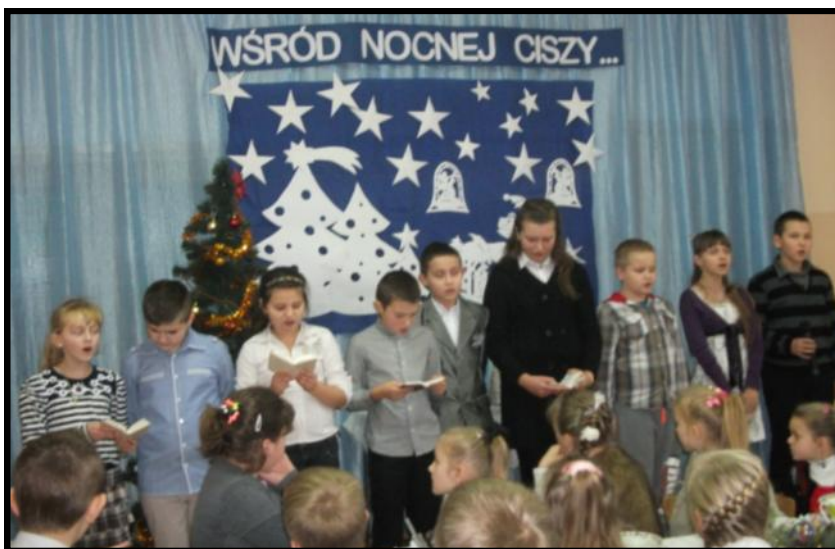
Uczniowie przedstawiają część artystyczną