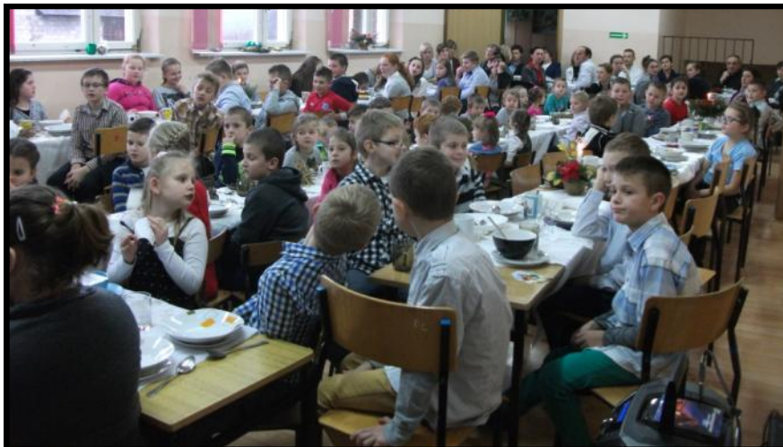
Dzieci, nauczyciele i rodzice przy Wigilijnym stole