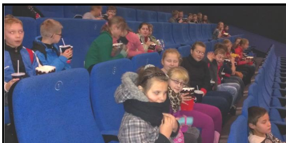
Dzieci w sali kinowej